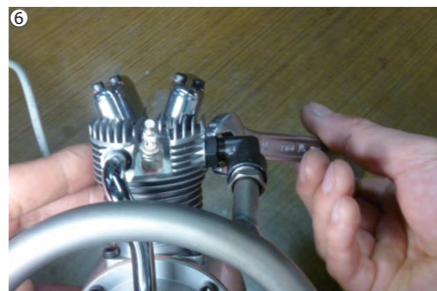
⑥アダプターナットをスパナで締め付けます。 ⑥Tighten adpoter nuts for all cylinders.