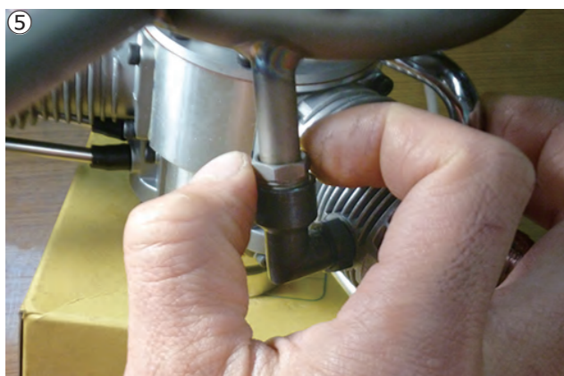
⑤各ナットを指で回せるだけ回してから、スパナで締めこみます。3つを均等に、少しずつ締めこんで下さい。 ⑤Tighten the nuts by fingers until it stops. Then equally tighten up each nut little by little with a spanner.