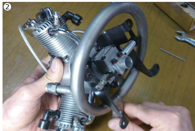
②リングマフラーを下方からくぐらせるようにして、マウント前方に入れます。 ②Insert the muffler from rear to the front of the mounts. First pass the under feet then pass the upper feet.