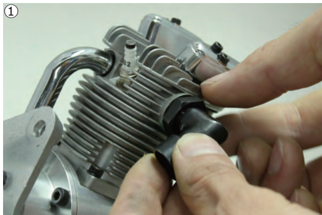
①アダプターのナットを全て緩めておきます。 ①Loose adpoter nuts for all cylinders.