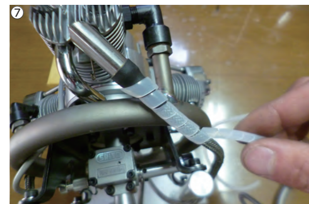
⑦コード類がマフラーに接触する部分には、スパイラルチューブを巻いて熱から保護して下さい。 ⑦Apply spiral tubes to protect the cords where touch the muffler.

チタン製リングマフラーは、ネジつぶれ、割れ等が起こった場合修理が出来ません。取り扱いにはくれぐれもご注意ください！