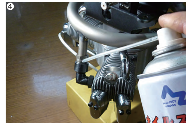
④マフラーナットのネジ部に、潤滑油を注油します。 ④Apply lubricant oil to the thread of the nuts.